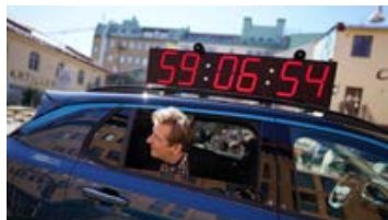
66 TIMMAR. Så länge sitter Otto Båth inlåst i bilen för att belysa långa trafikköer.