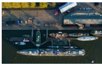
ÖPPNAR. Efter ett stängt år välkomnas besökare åter.

Om inte detaljplanen överklagas efter kommunfullmäktiges beslut så kan bygglov sökas och planerna kan realiseras för att utveckla Göteborgs nya entré.